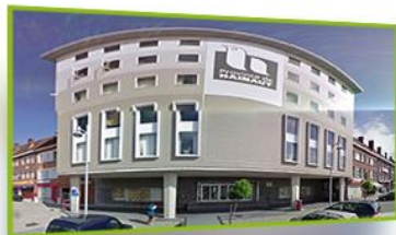
SAINT - GHISLAIN Rue de l'enseignement 45