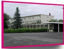
MONS - JEAN D'AVESNES Av. du Gouverneur E.Cornez 1