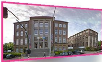
HORNU Rue de Valenciennes 58